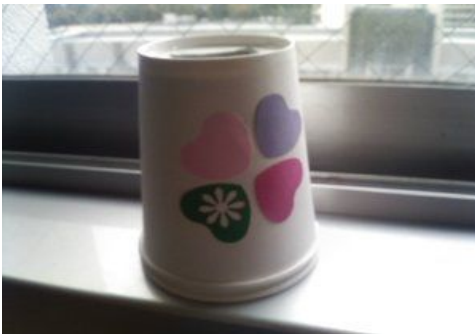
2012/10/27 11:52 光と色の不思議 手作り万華鏡 #tnctくぬぎだ祭