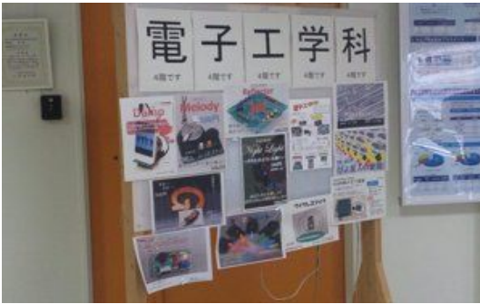
2012/10/27 11:45 電子工作教室は3棟4階です(o^O^)シシ☆ 来てね #tnctくぬぎだ祭