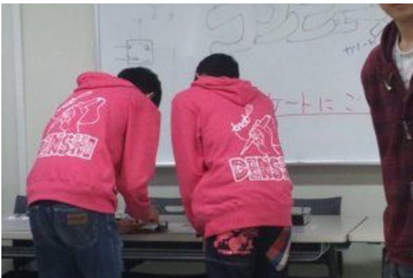
2012/10/27 12:00 電子のパーカー♪ #tnctくぬぎだ祭