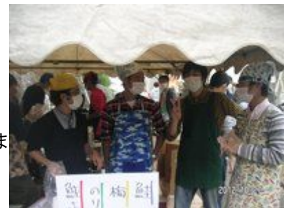
2012/10/27 12:35 4C お茶漬け屋のイケメンたち #tnctくぬぎだ祭