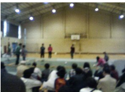
2012/10/27 12:35 ロボコンデモ中 第二体育館にてたくさん人がいます #tnctくぬぎだ祭