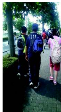
2012/10/13 08:49 ゆりのき台。峠越え #19ChallengeWalk