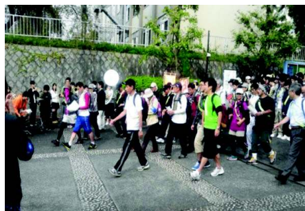
2012/10/13 08:34 いよいよスタートしました! #19ChallengeWalk