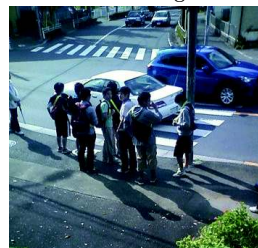
2012/10/13 08:41 信号待ち。皆さん真面目に待っている #19ChallengeWalk