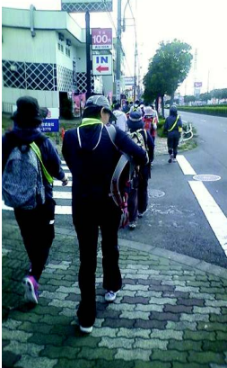
2012/10/13 08:30 皆さん話が弾めます。一部、リタイアの相談も聞こえました。 #19ChallengeWalk