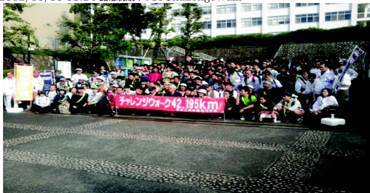
2012/10/13 08:25 只今8時25分。晴天の中スタートしました!一般の人から。 #19ChallengeWalk